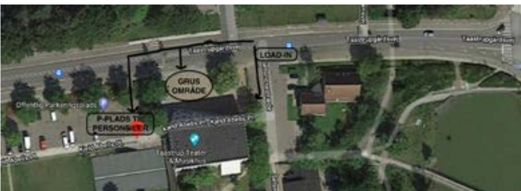
Oversigt over p-plads